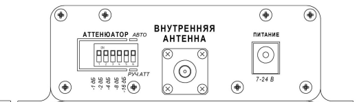
Рисунок 2 – Тыльная панель усилителя