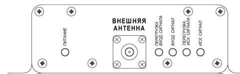
Рисунок 1 – Лицевая панель усилителя

На панели настройки усилителя размещен блок ручной регулировки усиления (аттенюатор), разъем питания и разъем для подключения внутренней антенны. На панели индикации расположены LED индикаторы и разъем для подключения внешней антенны.